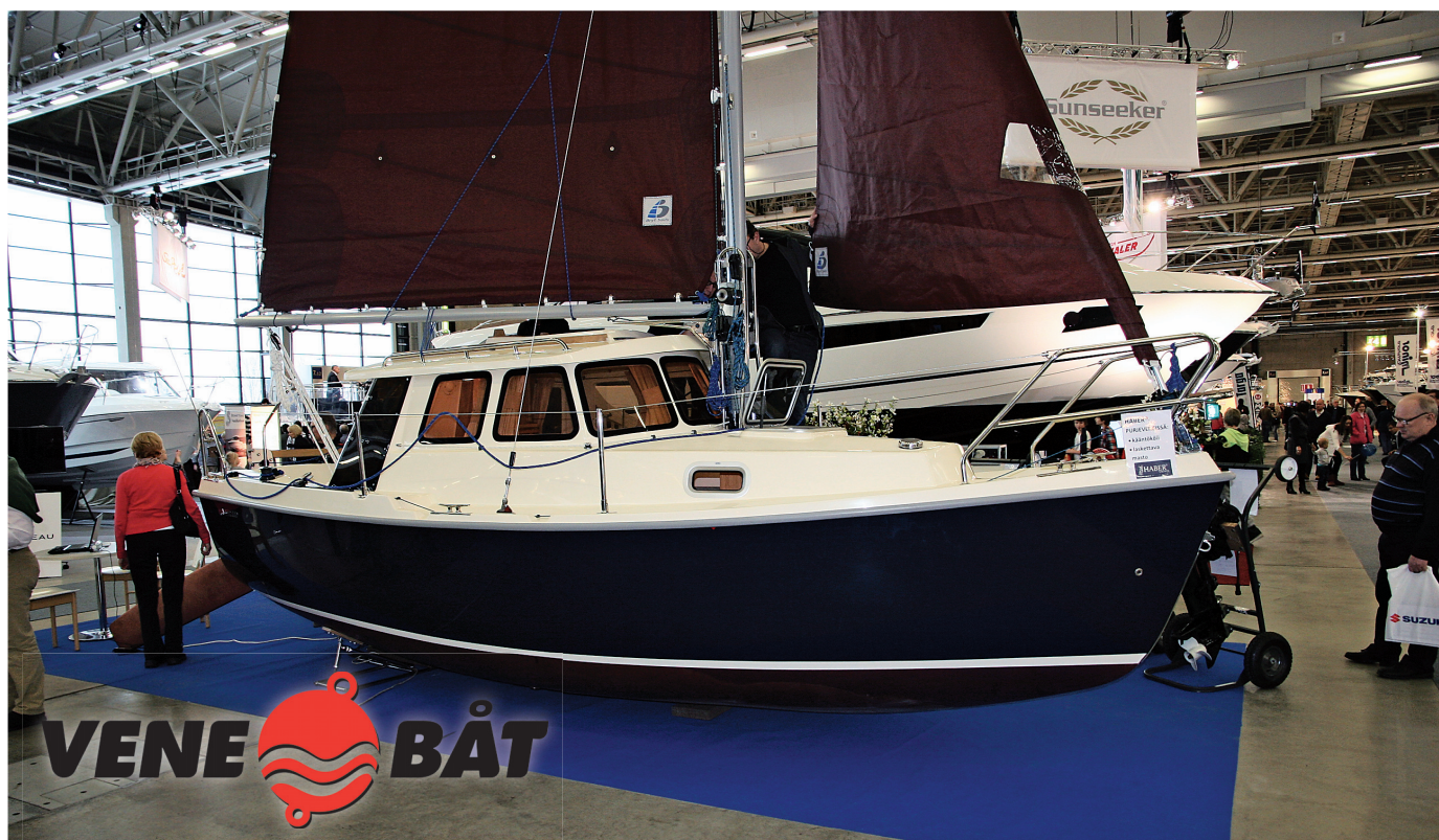
Польский мотосейлер Haber 660 сочетает высокое качество изготовления с умеренной ценой